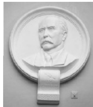
Горел’єф П.М. Ревуцького у фойє музичного училища ім. Л.М. Ревуцького

своєрідність якого полягає в інструментальному звучанні людських голосів у його творах. На ладовій базі Яворського він будує оригінальну форму народної краси та напруження. Лірика народної музичної творчості розпливається у багатьох сучасних ресурсах нової музичної мови. Народний музичний елемент є не тільки матеріалом для творчості, але головним чином його регулятором, у чому слід, як каже Грінченко, бачити великий крок у загальному процесі розвитку української музики.