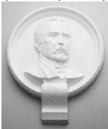
Горел'єф М.В. Лисенка у фойє музичного училища ім. Л.М.Ревуцького

Свою статтю він закінчує словами: “Але відкрити справжню українську народну пісню, її найбагатше джерело, зазначити її цінність як для музикантів, так і для всього суспільства - уся ця заслуга належить виключно Лисенкові.