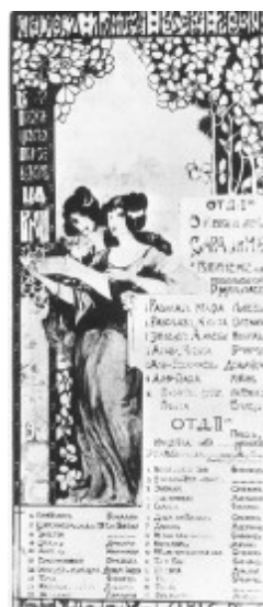
Афіша виступу Богославського в Ніколаєві