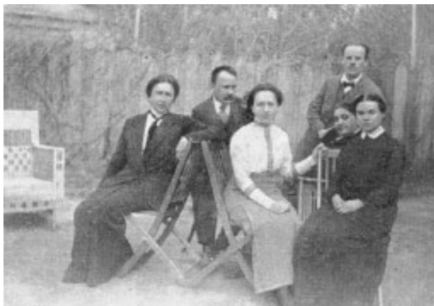
Група педагогів Московської народної консерваторії. Зліва направо: В.А. Фідлер, Є.В. Богословський, М.І. Медведєва, Б.Л. Яворський, Н.Я. Брюсова

У своїх працях зупиняється Богословський також на новій добі в історії української музики та її головних представниках: Ревуцькому, Козицькому, Вериківському.