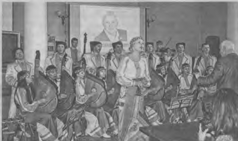
Виступає капела бандуристів ім. О. Вересая

На церемонію нагородження завітала практично вся чернігівська літературно-мистецька еліта. Йшлося не тільки про видатного класика української літератури, який тривалий час мешкав і працював на Придесенні, та не лише про заслуги нинішніх лауреатів. Звучали пропозиції щодо нового, достойного пам'ятника Леонідові Глібову — на чернігівському Валі —