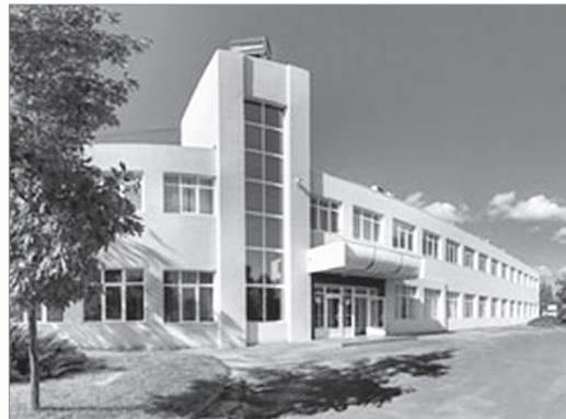
ЩОБ ПОБАЧИТЬ СХІДНИЙ СВІТ, ПОЧАЛИ З «МОРСЬКИХ ВОРИТ»

З року в рік ПАТ «Слов'янські шпалери-КФТП» намагається знайти нові та привабливі ринки збуту продукції. За словами головних спеціалістів цього підприємства, «шлях нашої продукції не виспананий трояндами». А тому керівництво підприємства постійно вміло вибудовує стратегію і тактику дій.