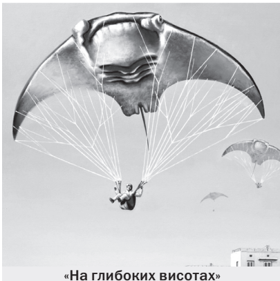
«На глибоких висотах»