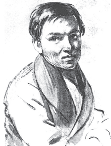
Портрет Сошенка. Мал. П. Ю. Заболотського, 1834 р.

Чернігівська обласна універсальна наукова бібліотека імені В.Г. Короленка