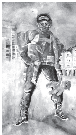
Герой. Ткачик Юлія. 15 років. Папір, акварель. ЧДХШ