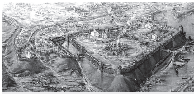
Панно Чернігів у XIII ст. Полотно, олія

У фотодокументальному фонді заповідника «Чернігів стародавній» зберігаються 695 світлин Георгія Петраша. На фотографіях зафіксовані Спасо-Преображенський, Борисоглібський, Троїцький та Успенський собори, П'ятницька, Катерининська та Іллінська церкви, дерев'яні будинки та вулиці старого Чернігова, краєвиди міста. Автор світлин зафіксував також руйнування історичних пам'яток та ву-