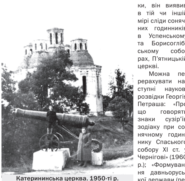
Катерининська церква. 1950-ті р.

лиць Чернігова під час Другої світової війни, відновлення пам'яток самого міста впродовж 1940-50-х рр.