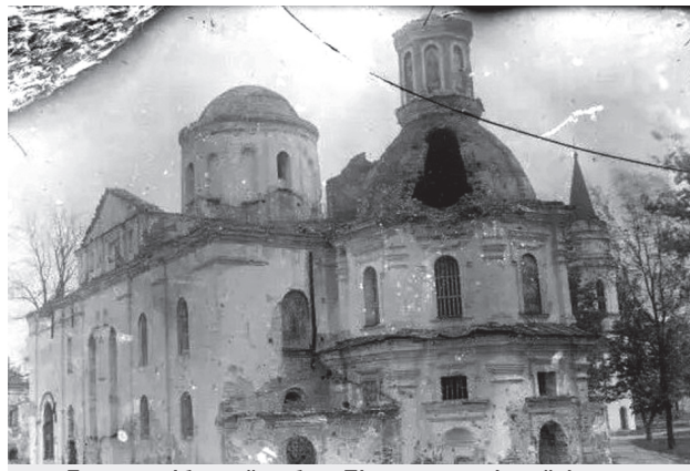
Борисоглібський собор. Південно-західний фасад. 1940-ті роки.