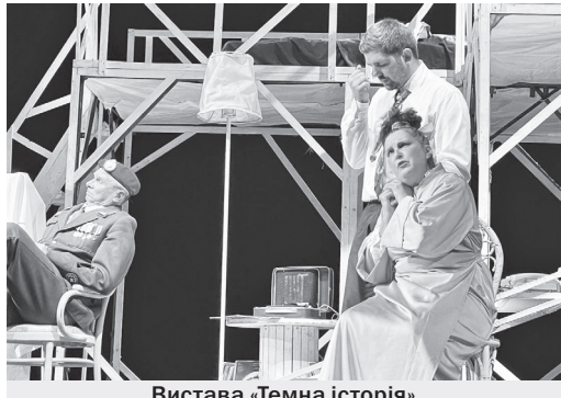
Вистава «Темна історія»