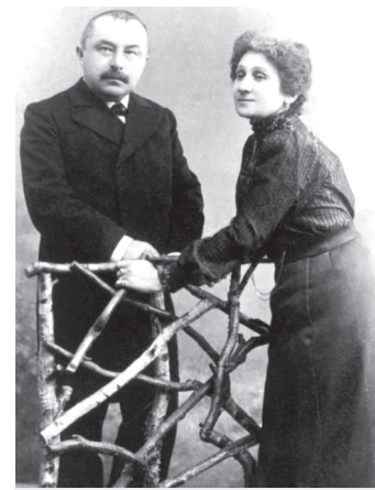
Василь Горленко і Марія Заньковецька

про українських письменників (Івана Котляревського, Тараса Шевченка, Панаса Мирного та ін.). Також досліджував творчість французького поета українського походження Віктора Гриценка. Горленку належать статті на історико-побутові та