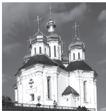
Видатні пам'ятки історії та культури: Спасо-Преображенський собор на Валу, один з найстаріших храмів України, якому вже майже тисяча років, поруч – Колегіум, а також Катерининська церква