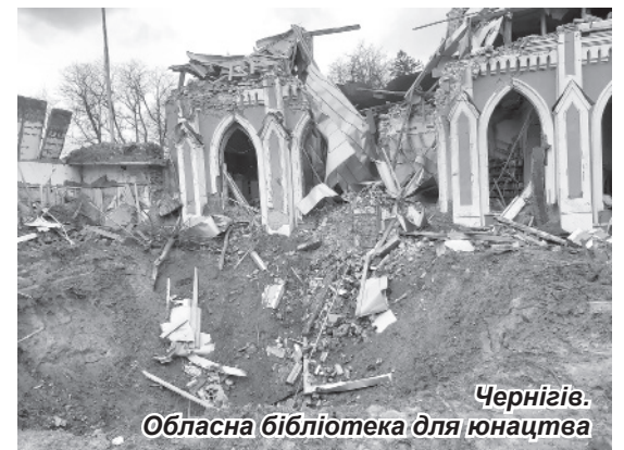
Чернігів. Обласна бібліотека для юнацтва

Катерининська церква Чернігова є пам'яткою архітектури національного значення, яскравим зразком козацького бароко Лівобережжя. Вона була зведена в 1715 році братами Лизогубами на честь їхнього діда та подвигів Чернігівського козацького полку на залишках храму часів Київської Русі. Унаслідок обстрілів 26 березня постраждав північний фасад церкви.