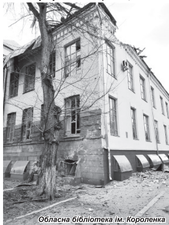
Оblasна бібліотека ім. Короленка

Будинок-музей Михайла Коцюбинського. Унаслідок артилерійського обстрілу 6 березня постраждали ганок, стіни, перекриття й вікна музею, пошкоджені деякі експонати.