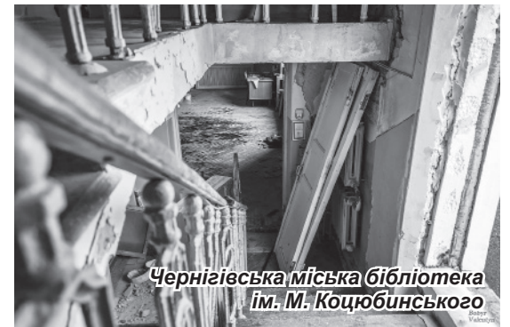
Чернігівська міська бібліотека ім. М. Коцюбинського

Обласний художній музей ім. Г. Галагана. Музей було створено у 1983 році в будівлі, що є пам'яткою архітектури XIX століття. Його колекцію складають