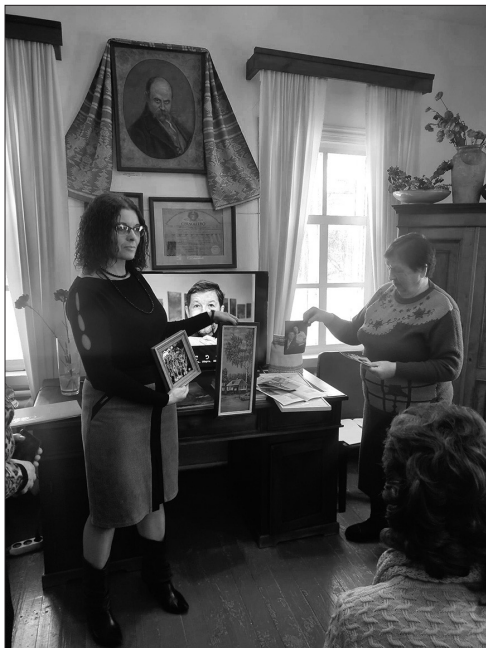
Музейні колекції поповнили роботи художника та фото з сімейного архіву