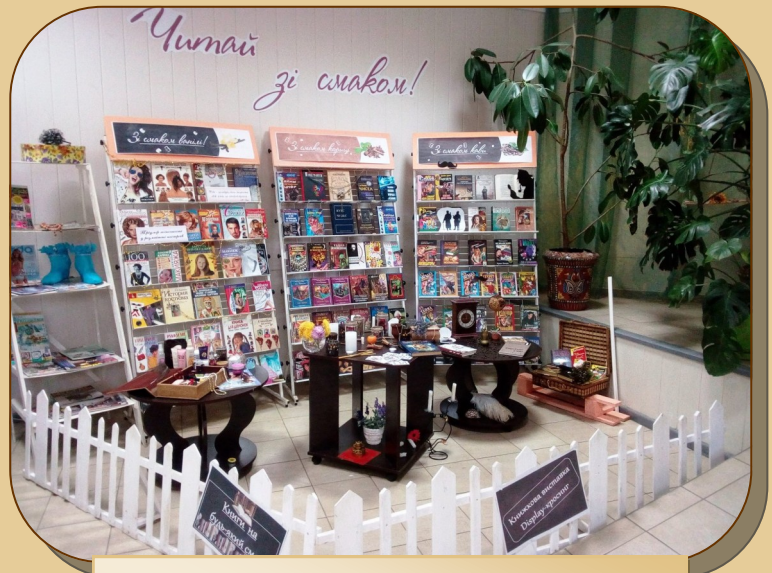
«Читай зі смаком», Чорноморська центральна міська бібліотека ім. І. Рядченка