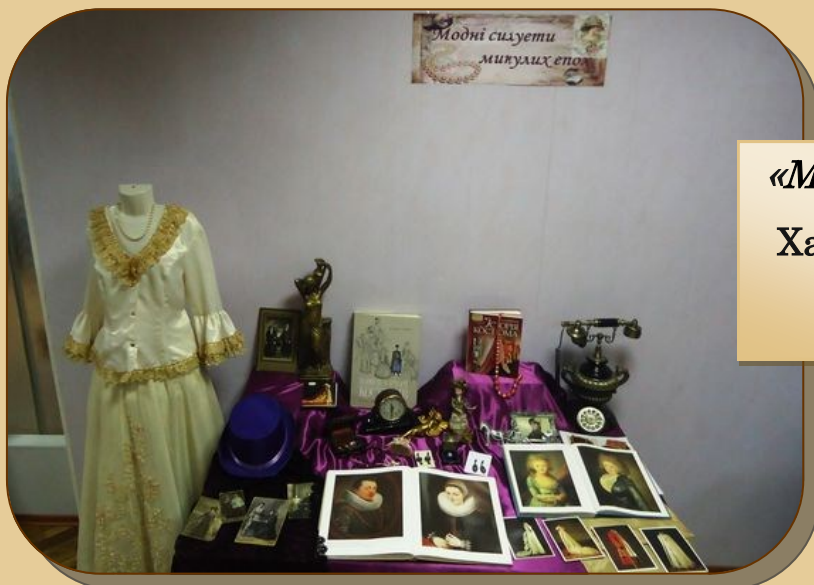
«Модні силуети минулих епох», Харківська обласна бібліотека для юнацтва