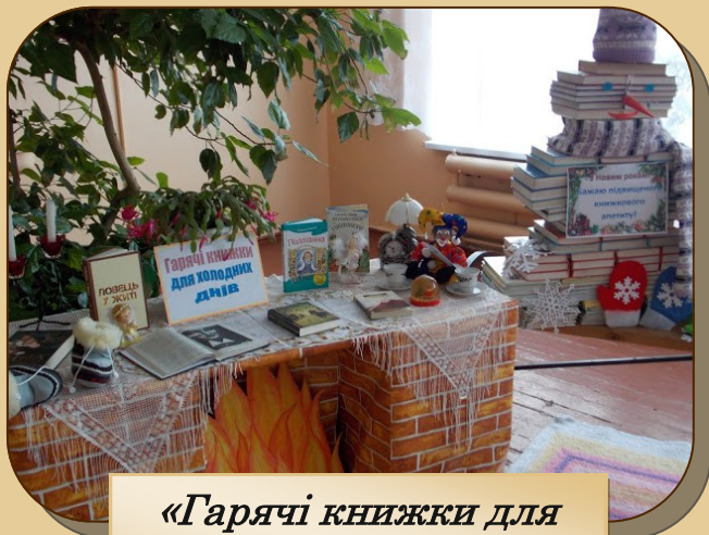
«Гарячі книжки для холодних днів»