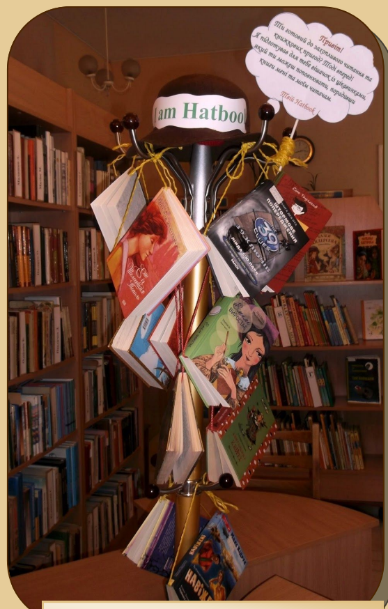
Вішачок із цікавинок