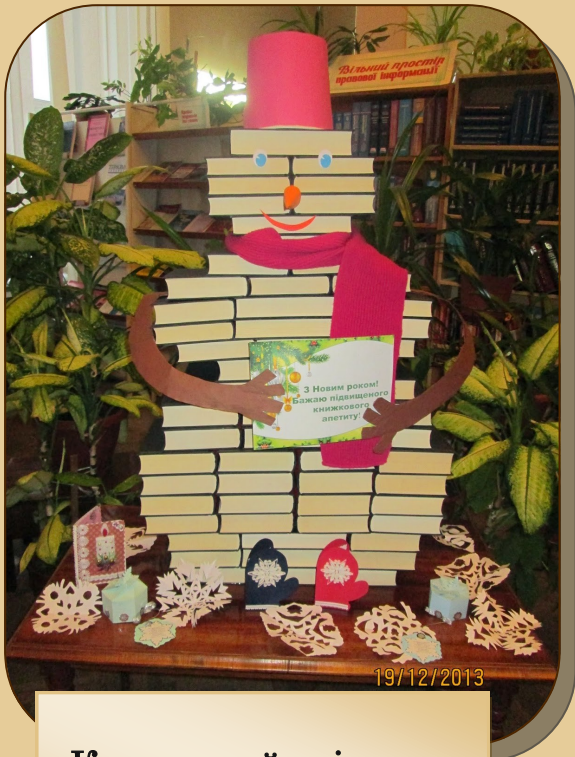
«Книжковий сніговик», Миколаївська ОУНБ