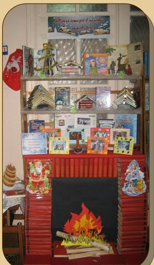
«В зимову холоднечу зігріє гарна книжка», Сумська обласна бібліотека для дітей