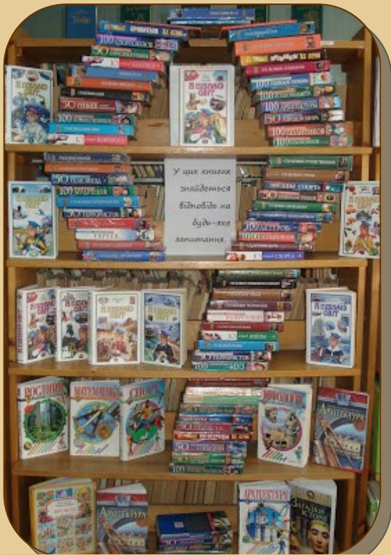
«Знак питання», Полтавська центральна міська бібліотека