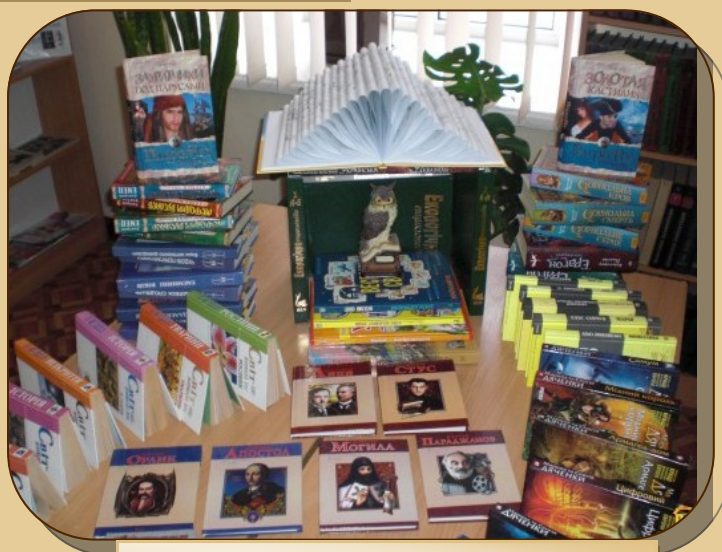
Первомайська міська ЦБС