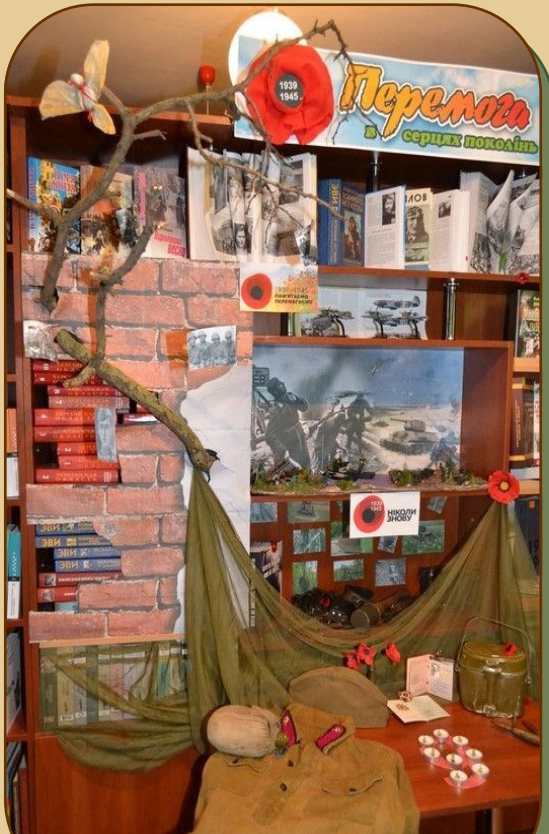
«Пам'ять в серцях поколінь», Херсонська обласна бібліотека для юнацтва ім. Б. А. Лавреньова