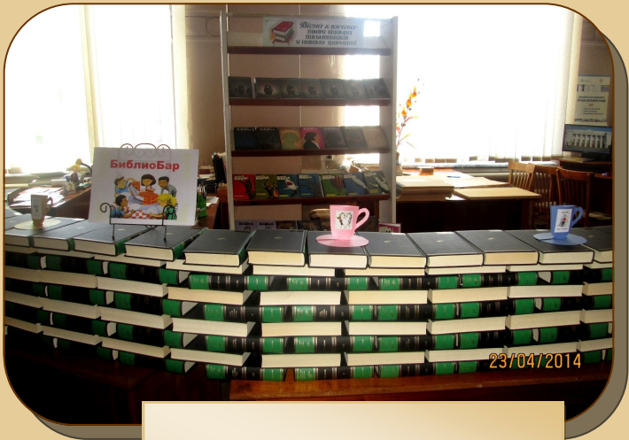
«Бібліобар», Миколаївська ОУНБ