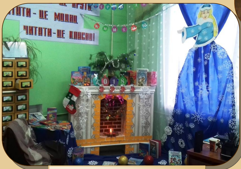
«Зігрій душу книгою»

бібліотека-філія № 5 Центральної міської бібліо- теки для дітей ім. Ш. Кобера та В. Хоменка м. Миколаєва