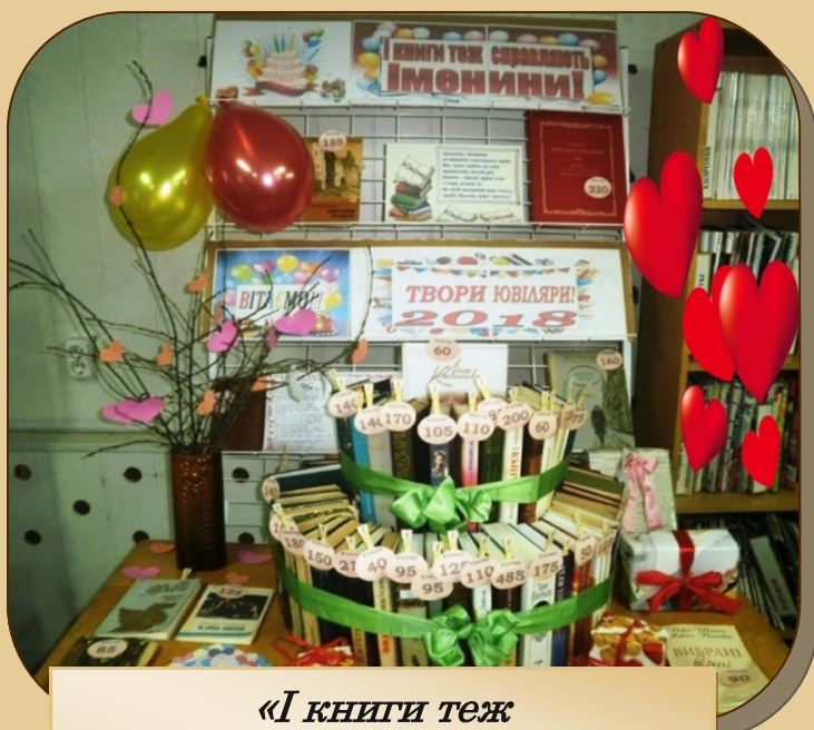
«І книги теж справляють іменини», Рокитнівська ЦБС