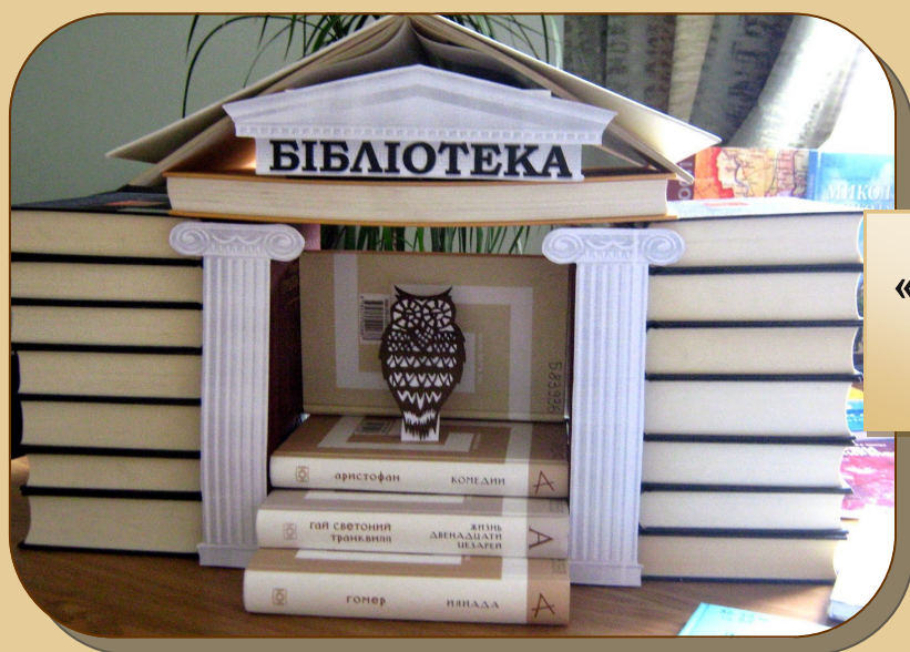
«Час іти до бібліотеки!», Миколаївська ОУНБ