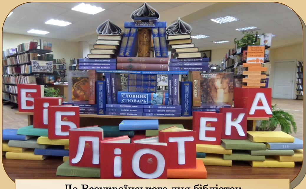
До Всеукраїнського дня бібліотек у бібліотеці-філії № 4 ЦБС для дорослих м. Дніпра