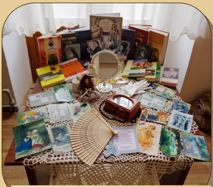
«Феномен жіночої творчості», Кіровоградська обласна бібліотека для юнацтва ім. Є. Маланюка