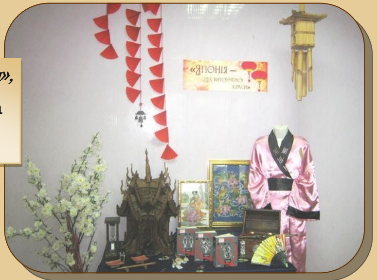
«Японія — дух витонченої краси», Харківська обласна бібліотека для юнацтва