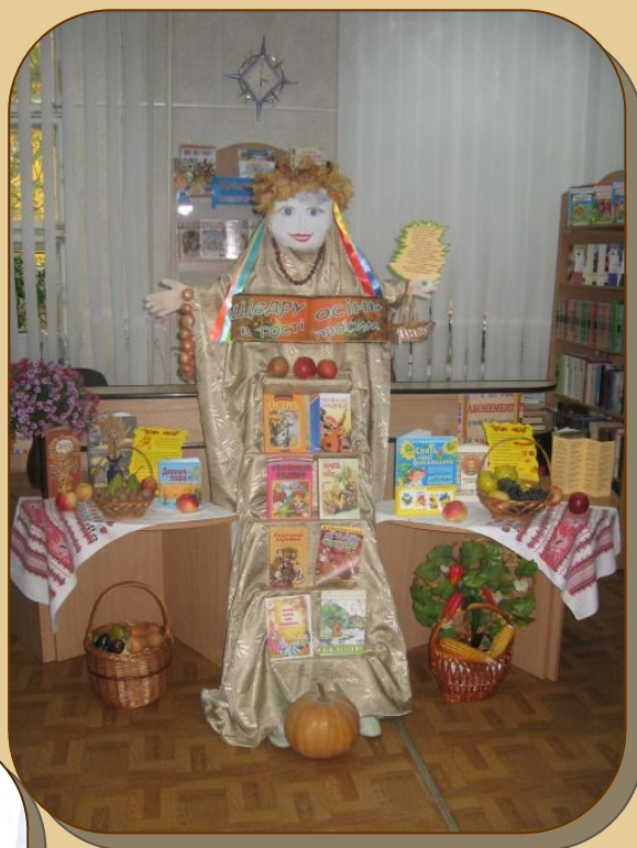
«Щедра Осінь – в гості просить»,

бібліотека-філія № 5 Центральної міської бібліо- теки для дітей ім. Ш. Кобера та В. Хоменка м. Миколаєва