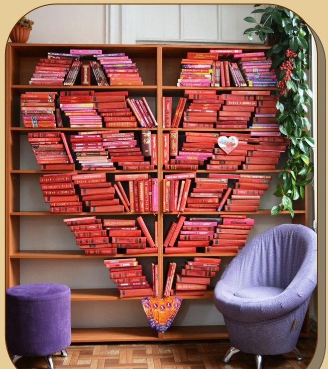
Фотозона до Дня закоханих у Запорізькій обласній бібліотеці для юнацтва