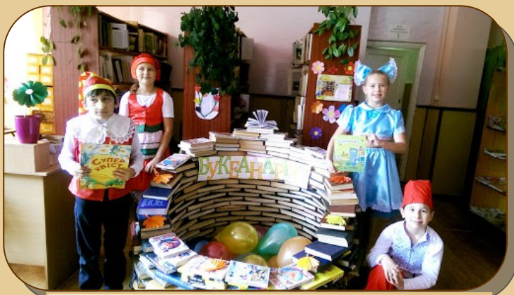
Букеанарій, Ізюмська міська ЦБС