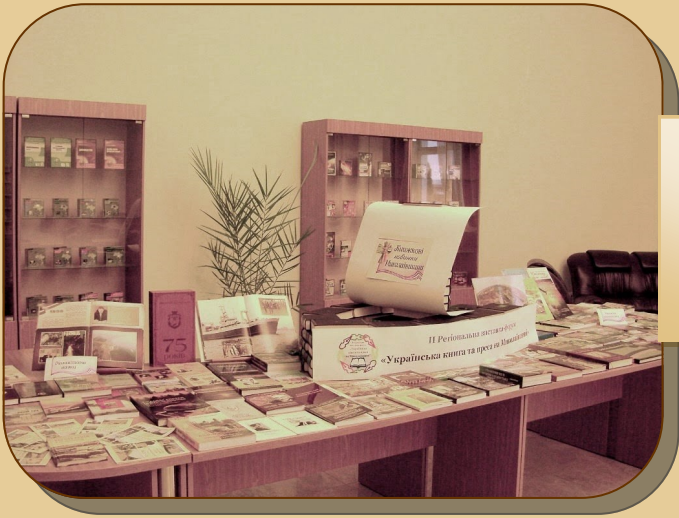
«Книжковий кораблик», Миколаївська ОУНБ