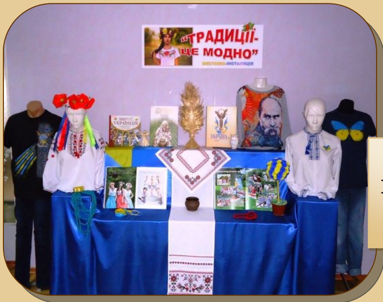
«Традиції — це модно!», Харківська обласна бібліотека для юнацтва