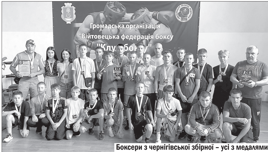
Боксери з чернігівської збірної – усі з медалями

Тринадцять вихованців (11 хлопців і дві дівчини) клубу «Лідер» успішно відбоксували на Відкритому турнірі з боксу, присвяченому пам'яті загиблих захисників України, що проходив у Хмельницькому.